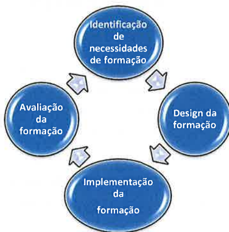
Figura I - Ciclo de Formação

O ciclo de formação instituído no CSM englobará quatro fases, as quais se encontram evidenciadas na figura infra ilustrada.