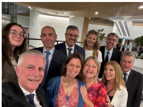
O Comité Organizador e Redator das C&R

. Entre os dias 19 a 21 de maio de 2025, decorreu em Singapura, no edifício dos Tribunais de Família, o IV Encontro Global da Rede Internacional de Juízes da Haia, seguida de uma conferência com juízes de família da Associação de Nações do Sudeste Asiático (ASEAN), onde o juiz de ligação português da Rede Internacional de Juízes da Haia participou, na qualidade de juiz de ligação, orador e membro do Comité Organizador e Redator das Conclusões e Recomendações, sendo responsável pela tradução para português.